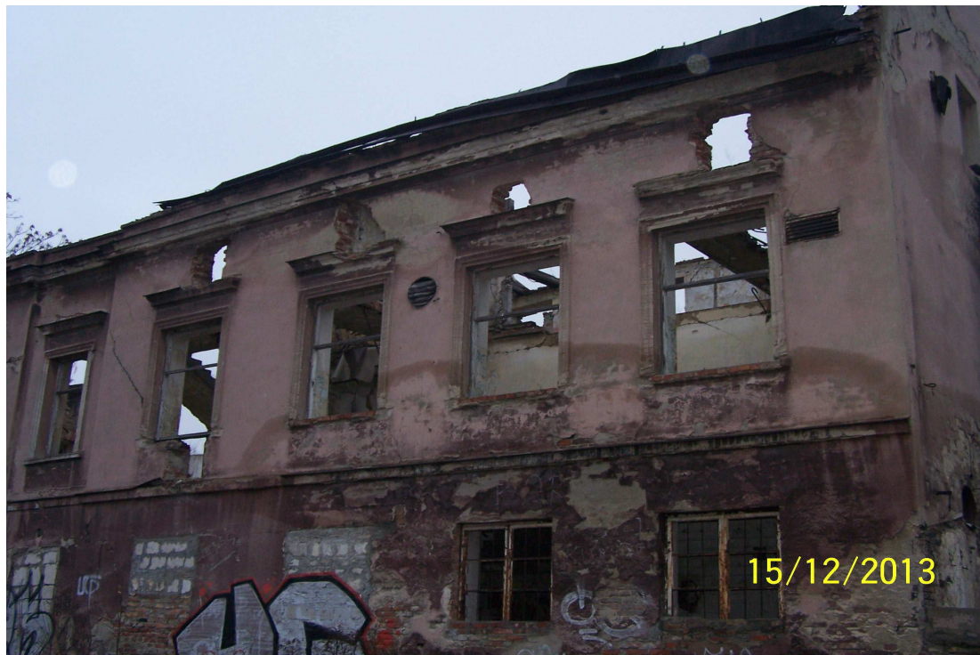
Stan przed częściową rozbiórką.